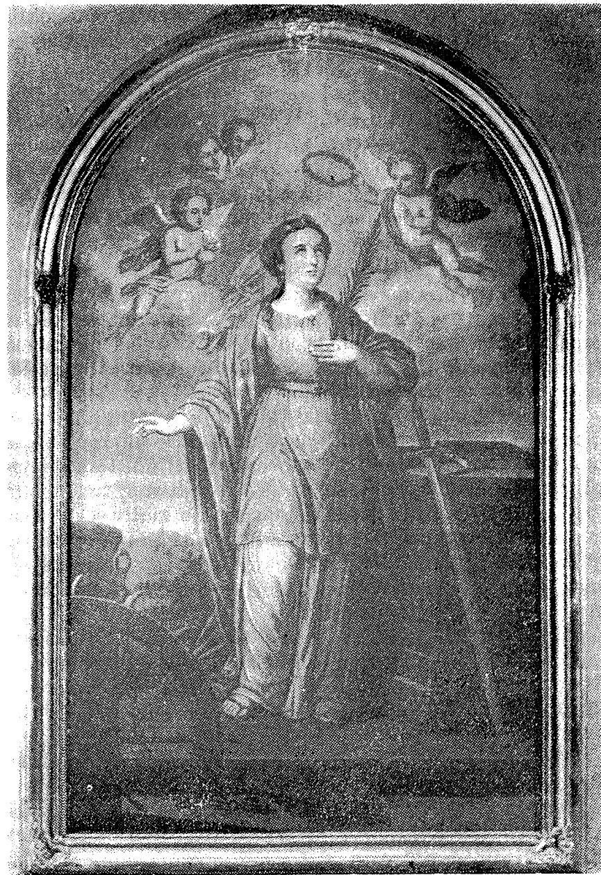
Oltarna slika sv. Katarine — danas u Dijecezanskom muzeju u Zagrebu