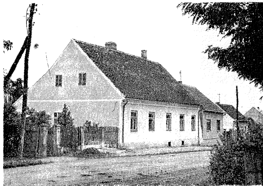
Nekadašnji župni stan u Gornjim Bogićevcima (foto: A. Ivandija)

Dragalić je popisivan zajedno s Medarima. Ne navodi se broj kuća, koje su također bile drvene i slamom pokrivena, već samo broj obitelji — njih petnaest. Od tadašnjih prezimena danas postoje još Derežanin (Dereza), Glavašević, Krajačić i Ivanović (Ivanić). U selu je bilo osam mladića i devet djevojaka. Seljaci su imali 5 konja, 14 volova, 15 krava, 15 teladi i junadi, 22 ovce, 26 svinja, dvije košnice pčela. Zajedno s Medarima posjedovali su oko 300 jutara plodne i 200 jutara neplodne zemlje, 100 jutara šume i oko 40 jutara livada. Starogra-