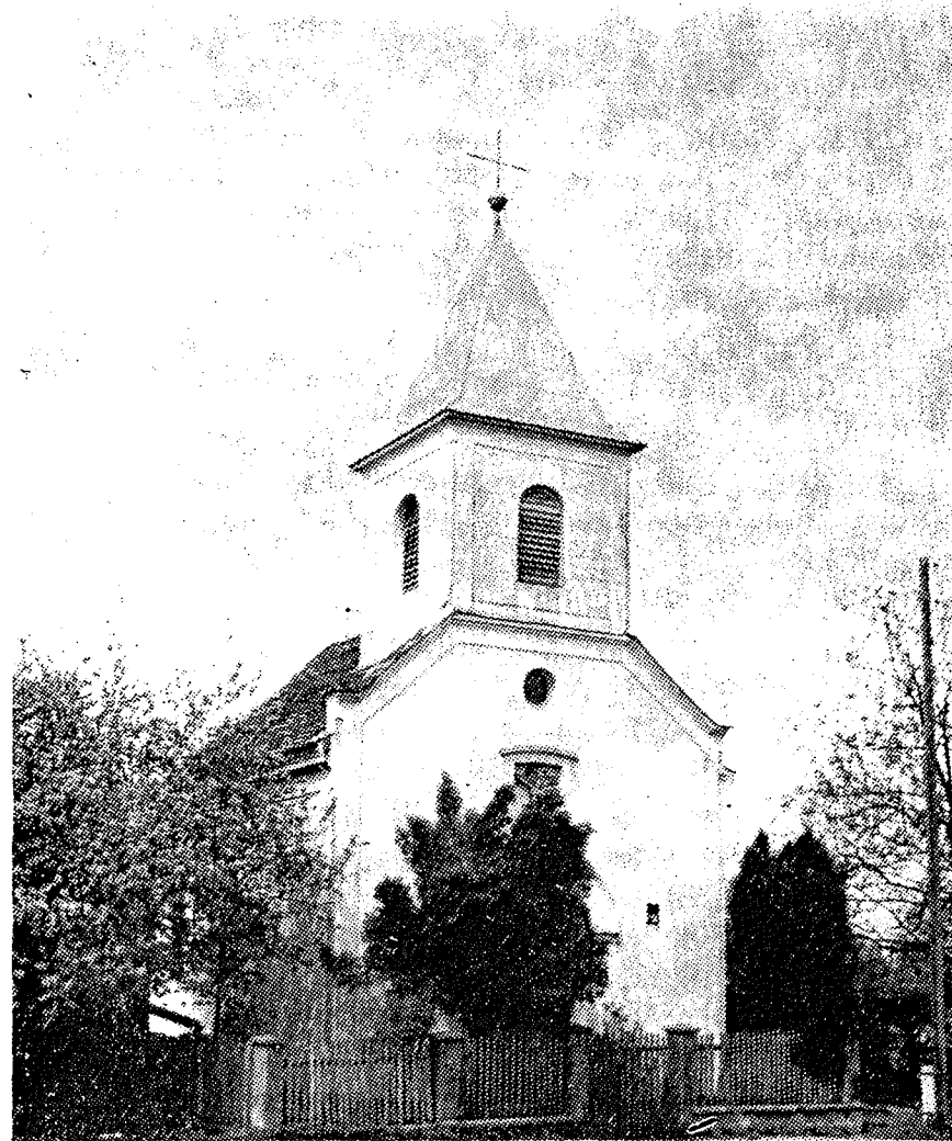
Kapelica u Goricama

9. studenog 1880. godine u pola osam ujutro osjetio se potres. Župnik Hemen je zabilježio da je župni stan škripao i njihao se, a čula se podzemna tutnjava. (Tada je nastradao Zagreb).