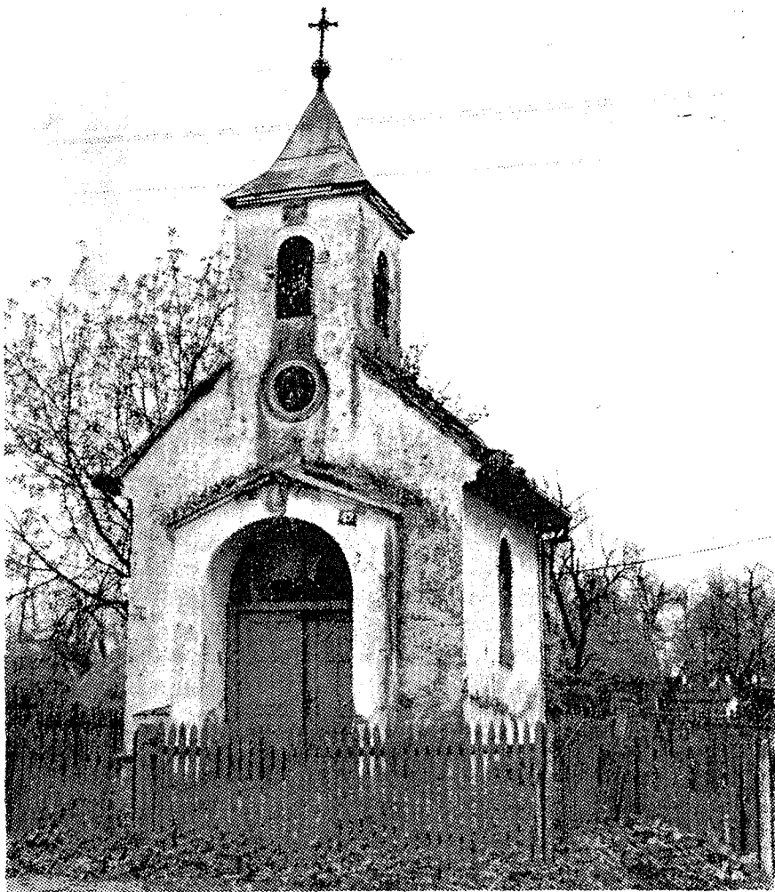
Dotrajala kapelica u Poljanama

bina podigla spomenik. Novogradiški dekan Josip Kolarić predložio je Nadbiskupskom duhovnom stolu da poslije njega imenuje nekoga odlučnog čovjeka koji će u župi uvesti reda.