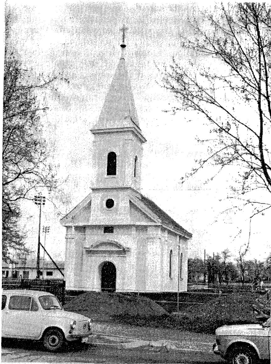
Župna crkva u Okučanima