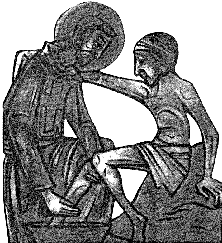
sv. Kamilo de Lellis u službi bolesnika

niku služi samome Kristu pa je koji put promatrajući bolesnika upadao u zanos. Njegov red se proširio i u drugim gradovima: Napulju, Milanu, Genovi, itd. Redovnici Kamila de Lellis imali su poseban dar za službu onima već na umoru pa ih je puk počeo nazivati "braćom dobre smrti". Sv.