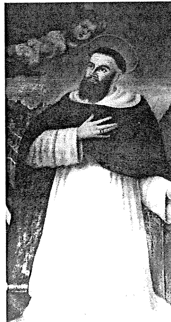
Blaženi Augustin Kažotić, biskup

➤ 29. rujan - Andeo Rafael - Bog liječi - Bog je ozdravio - zaštitnik liječnika, psihijatar, apotekara